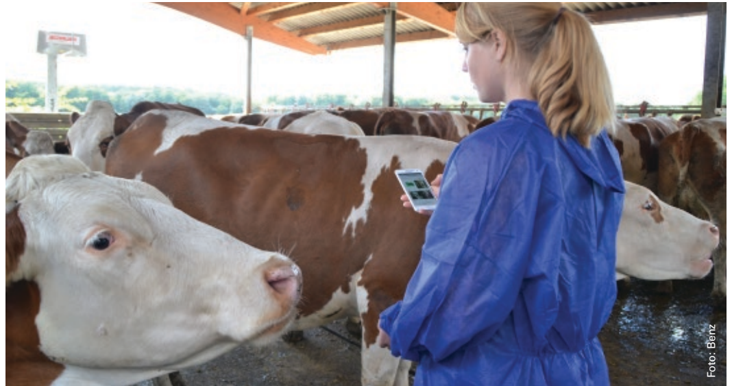
Abbildung 3 Anwendung der Smartphone- Applikation www.qwohl-bw.de im Praxisbetrieb

chen Handlungsbedarf besteht. Beide Applikationen funktionieren auch im Offline-Modus, so dass eingeschränkte Internetverfügbarkeit kein Ausschlusskriterium für die Anwendung darstellt.